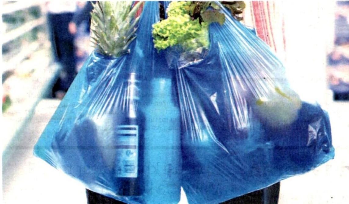
KESEDARAN rakyat Selangor mengenai kempen Bebas Plastik sejak 2017 masih rendah. – GAMBAR HIASAN