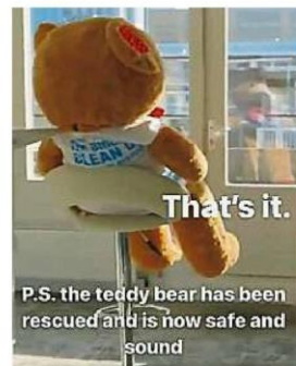
获救的泰迪熊在被清洗一番后，如今安顿在海洋基金会总部，成为拯救河流及海洋运动的吉祥物。

贴文指出，目前在巴生河操作的国内第一架河流垃圾拦截器，自2019年10月操作以来，是雪兰莪海上门户项目河流管理方案的其中内容，配合沿河56公里设置的7道拦物栅（log booms），拦下许多漂流垃圾。