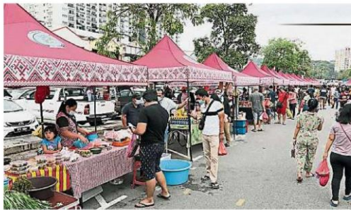
沙登婆羅洲市集每逢周六，早上7时至11时在沙登商業城營業。