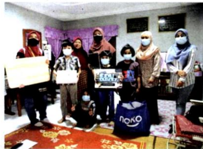
ANTARA penerima manfaat Projek Edu Tablet.

Pada setiap minggu 10 set tablet diagihkan kepada 10 keluarga. Pemberian sumbangan didatangkan sekali dengan meja lipat belajar, barangan asas dan kit pelitup muka dan sanitasi tangan.