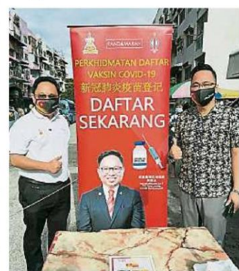
班达马兰州议员服务中心会选择在早夜市出入口摆摊,以方便及说服更多人登记接种疫苗。