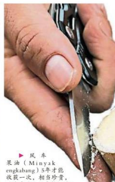
風車果油 (Minyak engkahang) 5年才能收一次，相當珍貴，不少東馬人用來拌飯吃；該果遇熱融化，就像牛油，香氣十足。