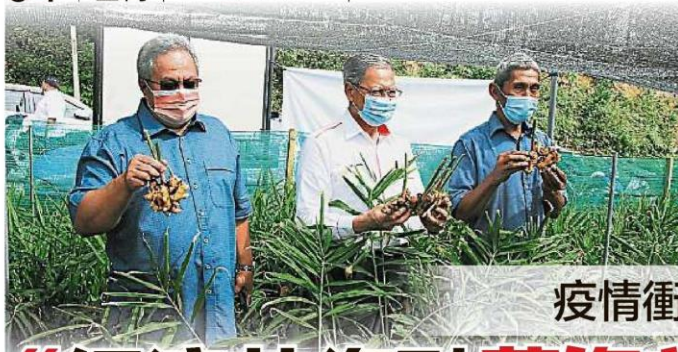
慕斯達法到森州仁保拉惹阿利亞斯土展區，巡視一名星殖民安藍(右)種植的美園，左為斯汀州議員三蘇卡哈。