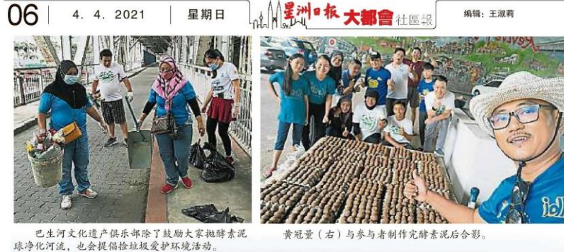
巴生河文化遗产俱乐部除了鼓励大家抛酵素泥球净化河流, 也会提倡捡垃圾保护环境活动。