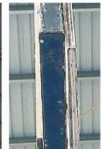
籃板厚度也被指不符合規格。