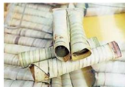
糯米糕 (Celorot) 也是傳統糕點之一。