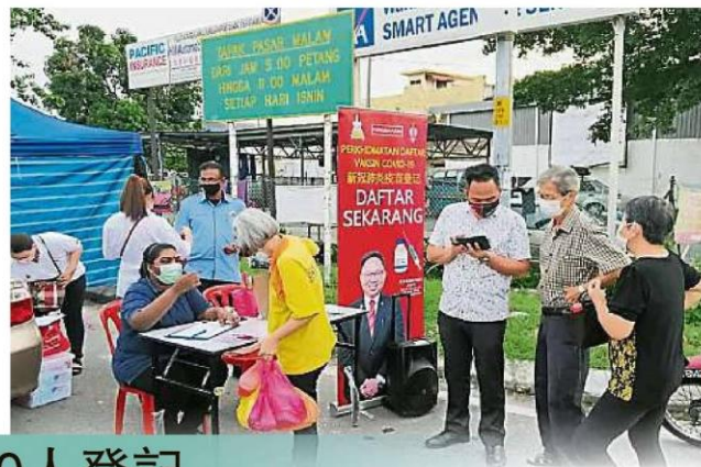
年长者主动前来登记接种疫苗。

尽管全国于3月初展开新冠疫苗接种登记以来,年轻人登记的反应算不错,不过雪州有超过90%的年长者尚未登记。在雪州冠病防疫特工队的号召下,雪州各选区州议员都纷纷举办接种疫苗登记活动,协助不会使用智能手机的年长者登记。