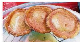
傳統糕點椰子糕在砂拉越被稱為Penyaram，在沙巴則稱為Penjaran，味道香甜。