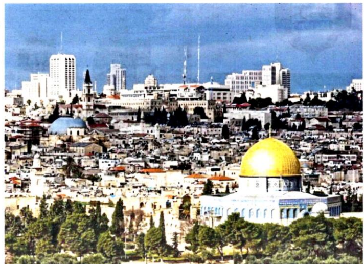
ADA pendapat menyatakan jasad Imam an-Nasaie dikedukungan di Baitul Maqdis.

Antara karya beliau ialah as-Sunan al-Kubra, as-Sunan al-Sughra, Khasa'is Ali RA, Musnad Ali RA, Fadha'il al-Quran, al-Manasik, Kitab at-Tafsir, ad-Dhu'afa wal Matrakin, 'Amal