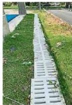
籃球場周圍髒亂不堪。