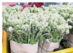
蔬菜 (Pucuk paku) 加上叁巴辣椒醬翻炒，就是一道美味佳餚。