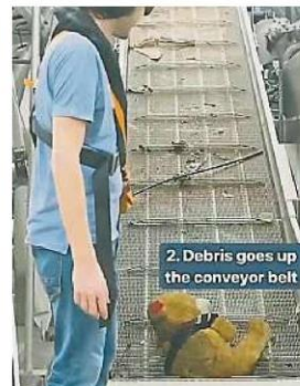
主持人在视频中介绍巴生河垃圾拦截器的操作方式和功能，可见在河上漂流的泰迪熊被拦截和升上输送带后，成功获救。

这导致相当多的网民在网上“唱衰”大马政府和有关当局无力清理被国人污染的河流，却得依靠外力来帮忙；此举等同抹杀了许多单位多年以来维护和清洁河流所付出的努力。