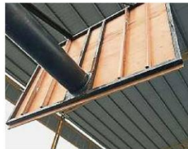
籃板手工非常粗糙, 承包商明顯敷衍了事。