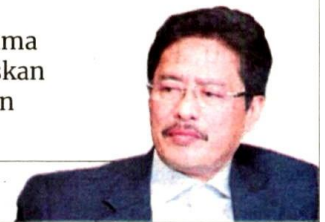
Azam Baki, Ketua Pesuruhjaya SPRM

“Sekiranya ada pihak berkuasa yang bekerjasama dalam kegiatan melupuskan sisa kumbahan, kita akan masuk (siasat)”