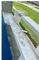
籃球場內的漆子表層開始脫落。